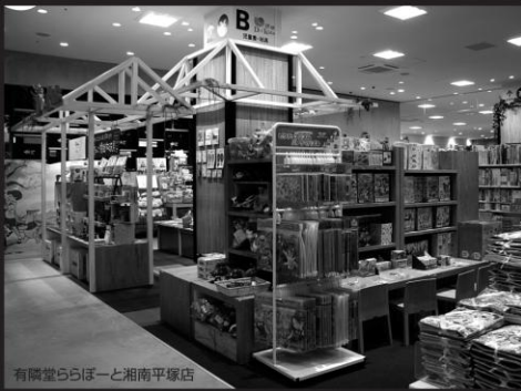
有隣堂ららぽーと湘南平塚店